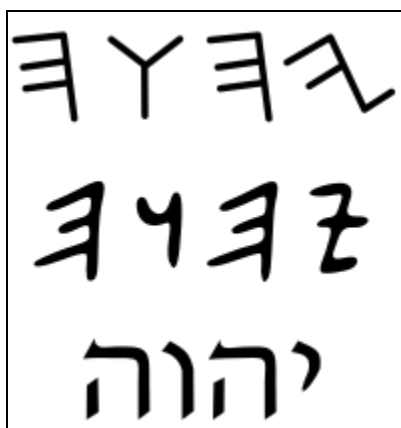
Le Tétragramme en phénicien, en araméen ancien et en hébreu carré.

Le nom Saint de Dieu est représenté par le tétragramme YHWH signifiant :