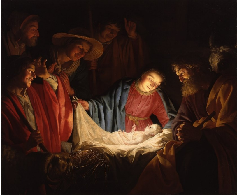
L'Adoration de l'Enfant (en italien : Adorazione del Bambino) est une peinture réalisée vers 1619 à l'huile sur toile par l'artiste hollandais du Siècle d'or Gerrit van Honthorst, conservée dans la Galerie des Offices à Florence.